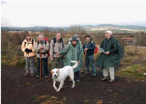
En chemin entre Chavagnac-Lafayette et Loudes