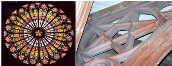
Cathédrale de Strasbourg - Rosace et détail d'une voûte du baptistère nord

Elle vit pour nous tous et du fait de son doigt unique pointé vers le ciel, elle reste une porte d'espoir pour notre temps. Chacun possède la liberté de suivre ou non, l'enseignement qu'elle nous a dévoilé.