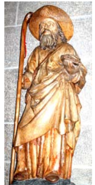
Saint Jacques Cathédrale du Puy

Afin que je grandisse vers les étoiles de mon plus haut destin.