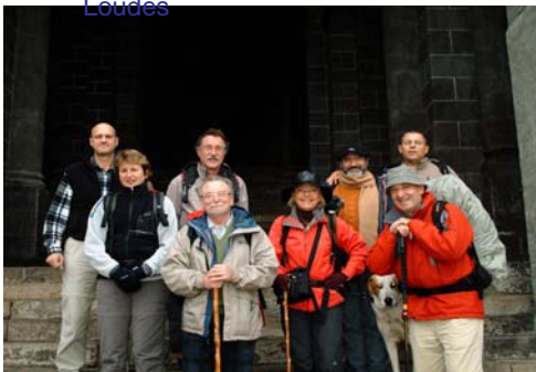
et devant la cathédrale du Puy

C'est ainsi que nous avons atteint LE PUY après des étapes qui nous ont mené successivement à COUDES , ISSOIRE , STE FLORINE , LAVAUDIEU , CHAVANCIAC-LAFAYETTE et LOUDES .