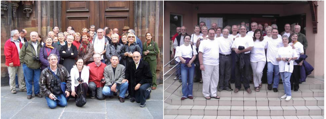
Notre groupe devant la Cathédrale de Strasbourg et revêtu du tee-shirt de la Confrérie devant l'entrée du gîte