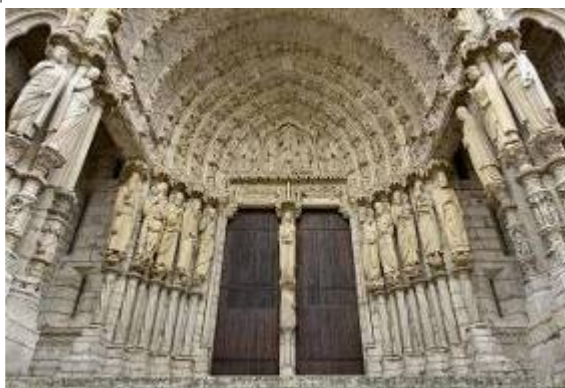
Cathédrale de Chartres Gérald sortant de la Crypte - « Emotion du départ »