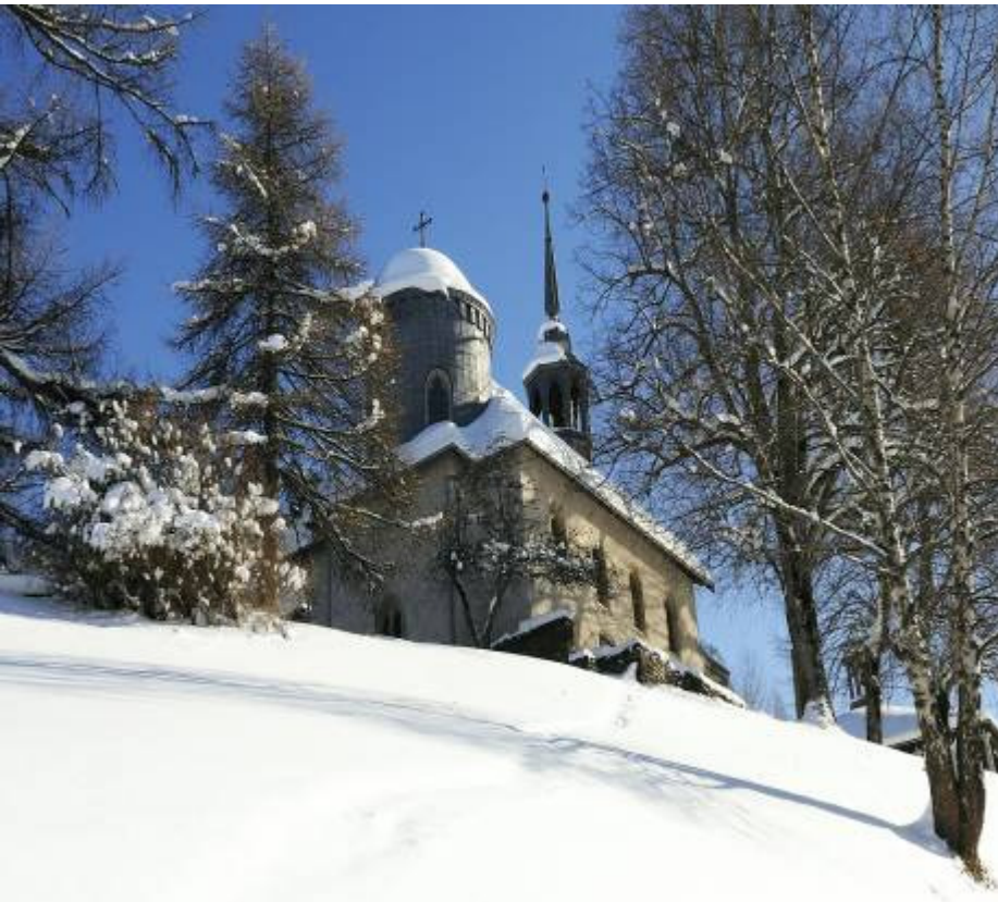
Une des stations du chemin de croix de Megève

Pour le chrétien, suivre Jésus c'est se laisser emporter par les paroles de celui-ci : « Je suis le chemin, je suis la vérité, je suis la vie » (Jean 14.6).