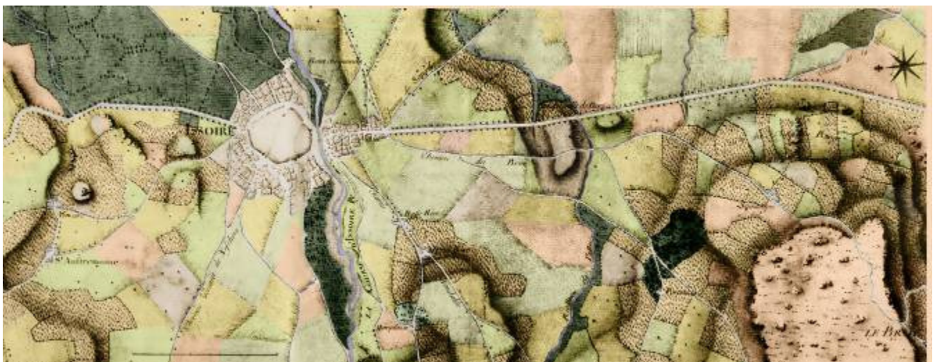
Carte de Cassini - Issoire, vue d'ensemble, XVII e siècle

De nos jours, les chercheurs consultent fréquemment cette carte, particulièrement les archéologues, les historiens, les géographes, les généalogistes, les chasseurs de trésors et les écologues qui ont besoin de faire de l'écologie rétrospective ou de comprendre l'histoire du paysage.