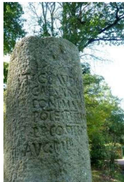
Borne milliaire d'Aulteribe

L'Empereur Tibère Claude fils de Drusus César vainqueur des Sarmates très grand Pontife, dans sa 5 e puissance tribunicienne, empereur 11 fois, Père de la Patrie, consul 3 fois