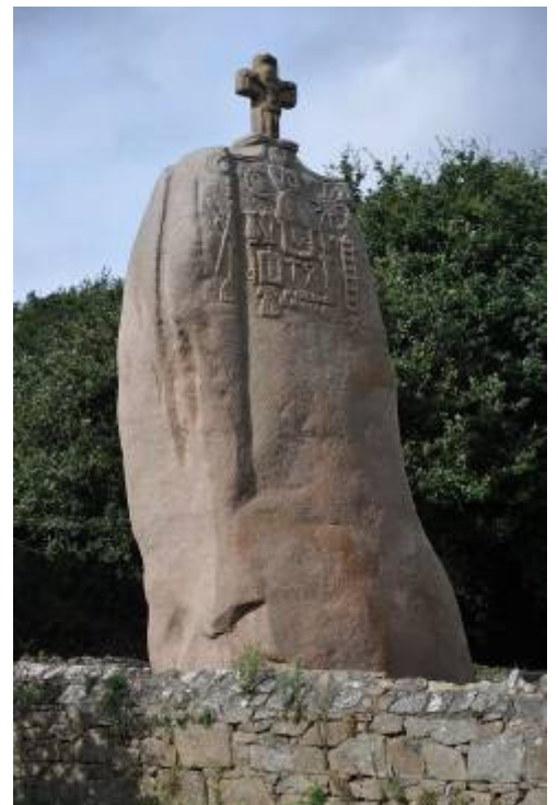
Beaucoup de menhirs ont été christianisés par l'adjonction d'une croix au Moyen Âge

Ce sont parfois enfin des croix de limite, religieuses ou profanes, servant de borne.