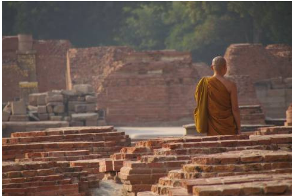
Sarnath, Inde du Nord

En Inde, tous les lieux associés à la vie du Bouddha sont toujours des centres de pèlerinage, non seulement pour les bouddhistes, mais aussi pour les hindous de tous les milieux, car, en tant qu'avatar de Vishnu, on le considère comme un grand maître spirituel.