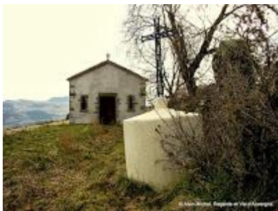
Chapelle sainte Marcelle de Chauriat.

Par la suite, des moines bénédictins firent construire à Chauriat, en 976 une église en son honneur, sous le nom de : sainte-Marcelle."