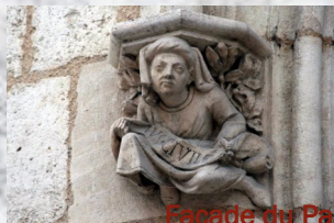
Façade du Palais Jacques Coeur