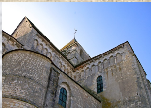
L'abbaye de Plaimpied et sa célèbre crypte