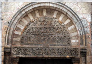
Le portail Saint Ursin