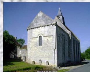
La crypte et l'église de La Celle-Condé