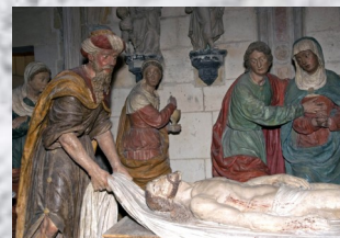
La crypte de la cathédrale