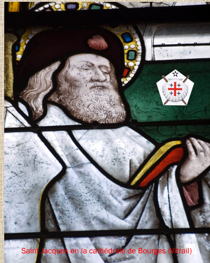
Saint Jacques en la cathédrale de Bourges (Vitrail)