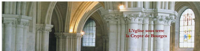
L'église sous terre la Crypte de Bourges